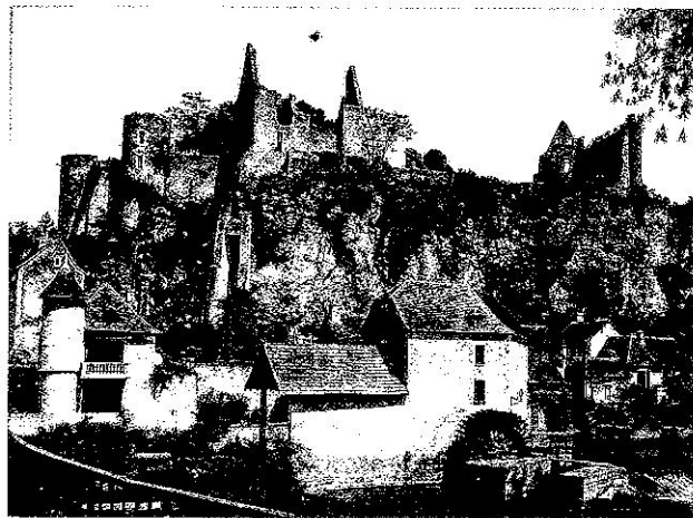
Vue de château

au XII e siècle. Sa forme rectangulaire, ses murs épais, ses rares ouvertures qui semblent avoir été primitivement carrées, l'apparentent au donjon archaïque du château des évêques à Chauvigny. Mais nous voyons aujourd'hui une forteresse modifiée au XV e par Hugues de Combarrel, et profondément comme en témoigne le pignon gothique qui à l'Est s'appuie encore sur la vieille tour (L). Les remaniements du XV e siècle